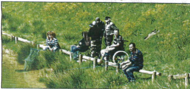
Une belle après-midi au bord de l'eau

C'est devenu une habitude et un rendez-vous très attendu : deux à trois fois par an, l'Association de Pêche de Saint-Jean organise une après-midi avec les résidents du Foyer Fond Peyré, centre pour traumatisés crâniens. Une après-midi de « pêche encadrée » qui permet, en toute décontraction et convivialité, de partager un bon moment autour d'une passion commune : l'association