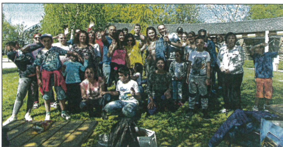
Une journée sous le signe de la bonne humeur

Samedi 22 avril, le Centre Social était en vadrouille en Aveyron, au Parc animalier de Pradinas. Petits et grands, en famille ou entre amis, sont allés à la rencontre d'animaux stars du cinéma, ils ont assisté au nourrissage des loups, et ont visité le musée des traditions agricoles. Le beau temps a permis de faire une agréable pause pique-nique, puis un bon goûter, avant de prendre le chemin du retour. A noter que ces sorties sont proposées plusieurs fois par an pour permettre à chacun de faire une pause dans une ambiance conviviale qui favorise les rencontres, les échanges et le "Vivre ensemble". La prochaine sortie