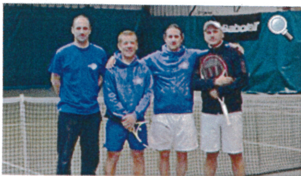
L'équipe des 35 ans masculins demi-finalistes.

Publié le 02/01/2014 à 03:51. Mis à jour le 02/01/2014 à 09:29