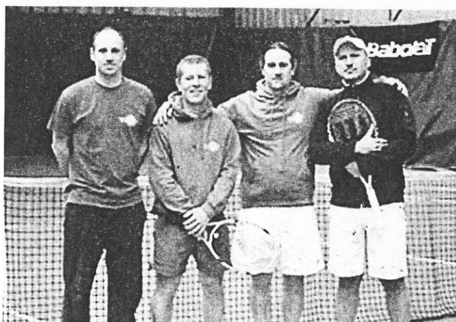
Les masculins 35 ans.

En ce début de décembre, les féminines du TC Saint-Jean ont accompli un petit exploit en remportant sur les terrains de la ligue à Balma pour la 3 e année consécutive le championnat régional (division pré nationale) en battant Portet 3/1.