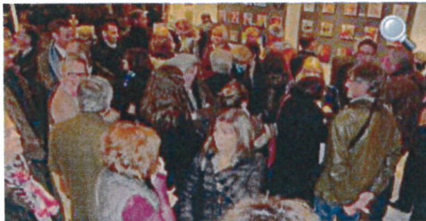
Les connaisseurs sont venus nombreux au vernissage.

Publié le 26/12/2013 à 03:52, Mis à jour le 26/12/2013 à 09:02