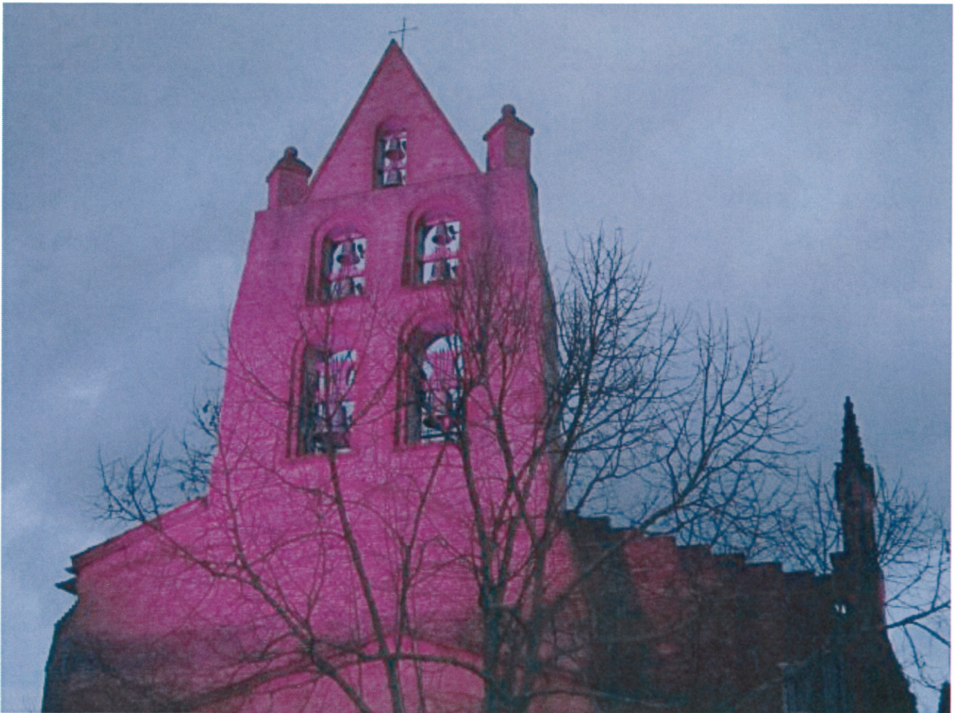
(L' église illuminée)