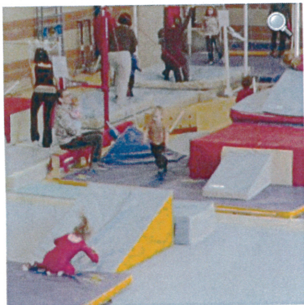
Les «baby» ouvrent la fête de Noël 2013.

Avant de se séparer pour fêter en famille les fêtes de Noël et Nouvel An, la tradition a été respectée au Saint-Jean Gymnique. Près de 250 gymnastes de tous âges ont été réunis dans le gymnase pour donner un aperçu de leur progrès acquis depuis la rentrée de septembre. Sur un programme concocté par les entraîneurs Shanaz, Coralie, Pauline, Sophie, Camille, Thomas, Yann, orchestré par Pascal, tous les enfants ont donné le meilleur d'eux même au grand plaisir de leurs parents. Pour terminer un buffet de gâteaux, friandises et boissons a été offert à l'ensemble des participants qui se sont séparés en se souhaitant de très bonnes vacances, de bonnes fêtes et le plaisir de se revoir dès le 6 janvier.