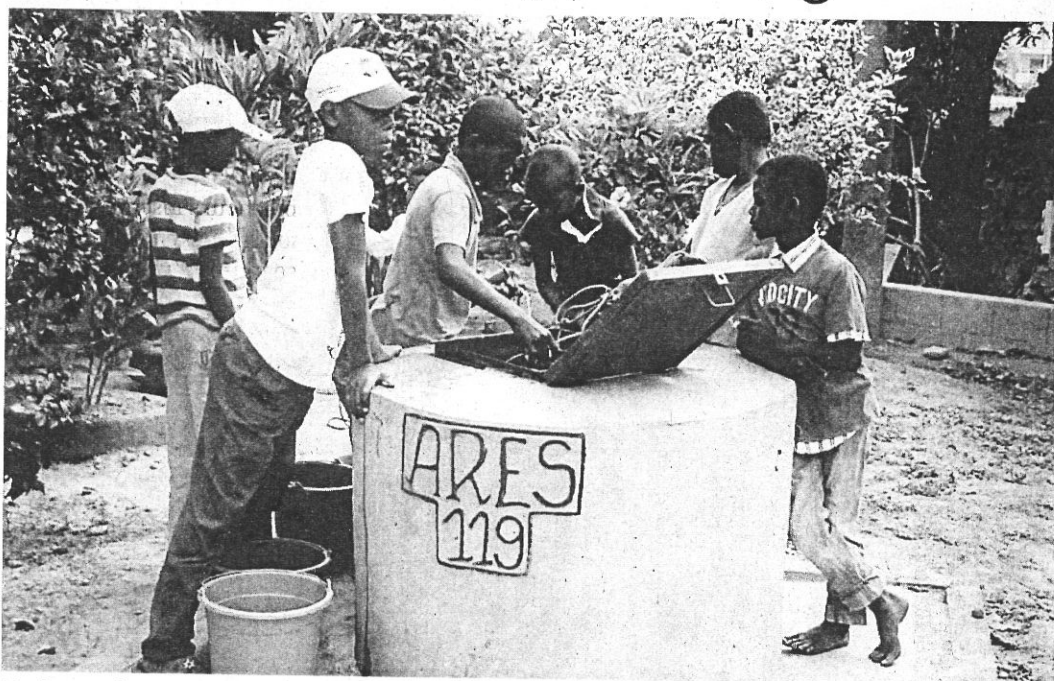
Un des nombreux puits signés « Ares » creusé pour le plus grand bien des Malgaches.