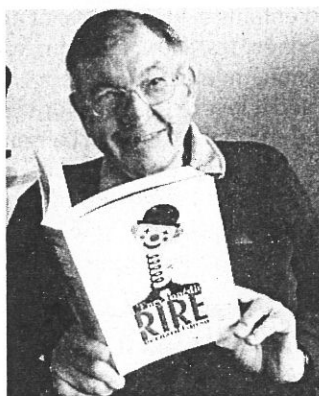
Bernard Guyso... pour rire !

Ce même vendredi, à 21 heures à l'Espace Palumbo théâtre avec la pièce « Sexe, mensonges et jalousie » par