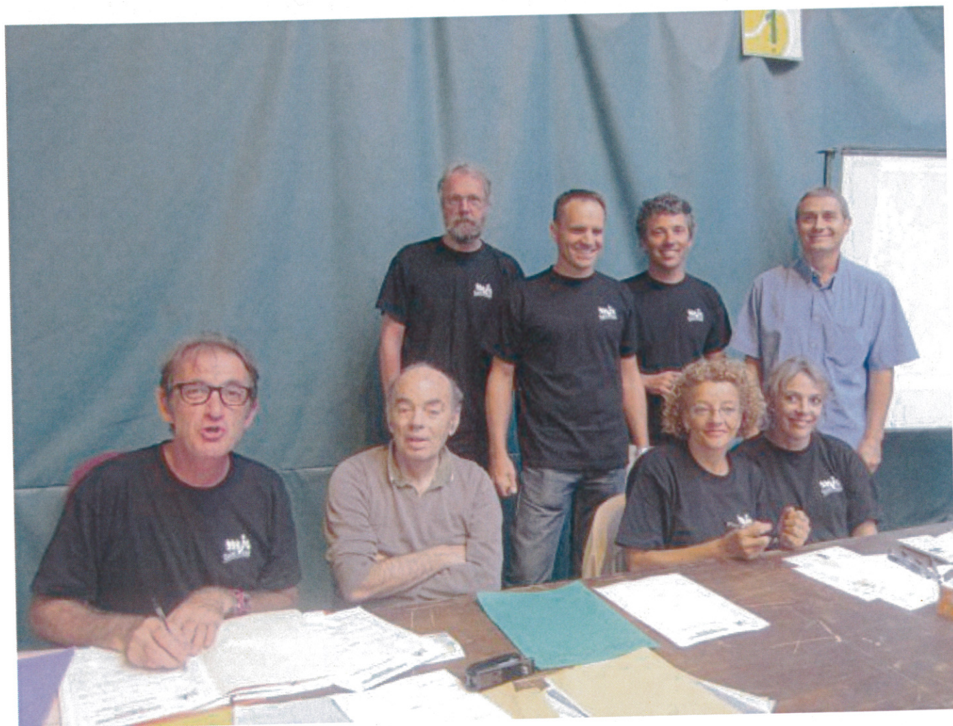
(L' équipe de la MJC, fin prête pour 2014)