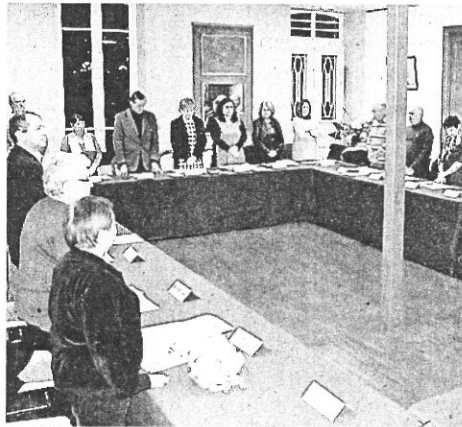
L'hommage du conseil municipal à la mémoire de Nelson Mandella.

Si près de Noël la question des crèches n'a pas échappé à Philippe Ecarot (opposition SE). Il a demandé pourquoi