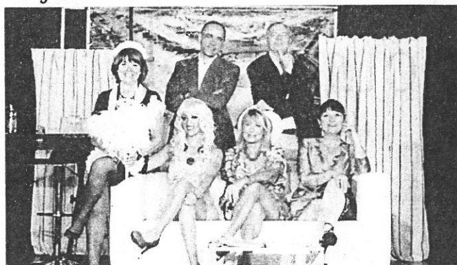
La compagnie Les couleurs de la comédie ce soir à l'Espace Palumbo.