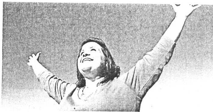
La perte de poids passe par des ateliers de loisirs sportifs.