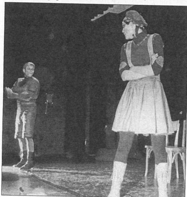
Les deux acteurs