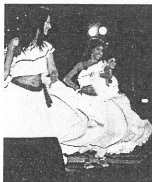
Danseurs et musiciens de Mestizos, pour une soirée haute en couleurs.

Dans le cadre des Soirées musicales de Saint-Jean, est proposé un spectacle festif et haut en couleurs avec l'ensemble folklorique colombien Mestizos. Cette troupe composée de danseurs et de musiciens emportera le public dans un tourbillon de rythmes, de musique et de danses vers la Colombie. Avec la cumbia, le merrecumbé, le pison, la jota chocoana, le bambuco et la salsa caleña, il sera possible de découvrir la diversité des musiques traditionnelles des différentes régions de la Colombie. Or-