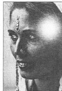
Femme nomade en costume de fête

Dans le cadre du festival "Mai Photographique", et sur le thème de la condition féminine vue par la ville de Saint-Jean, la bibliothèque municipale présente des photos de Chantal Craipeau prises en Inde, dans la province du Rajasthan. Femmes et fillettes nomades, enfants au regard farouches, écolières en uniforme, femmes parias, riches ou pauvres... des visages touchants et dignes à découvrir! L'exposition se poursuit jusqu'au 30 mai, aux heures d'ouverture habituelles de la bibliothèque.