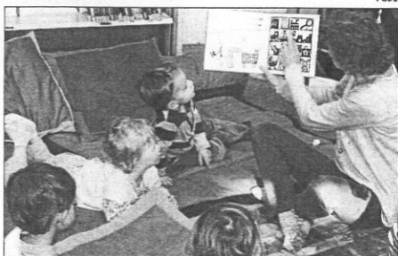
Des histoires et comptines à écouter sans modération