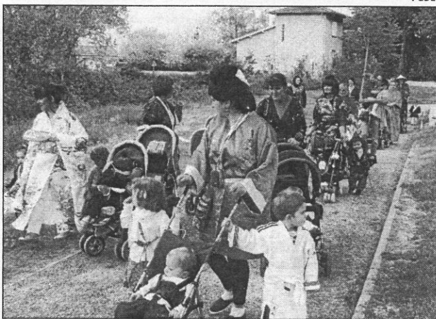
Un défilé haut en couleurs