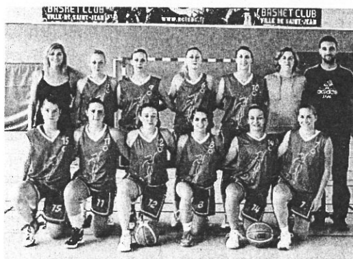
L'équipe seniors en finale des Pyrénées. s'inclinent en demi-finale TOP12 face à Rodez. Après une très belle saison ce sont des phases finales exceptionnelles que proposent ces équipes de jeunes filles.

Dimanche dernier, les minimes filles Région se sont inclinées face à Tarbes en finale, les cadettes