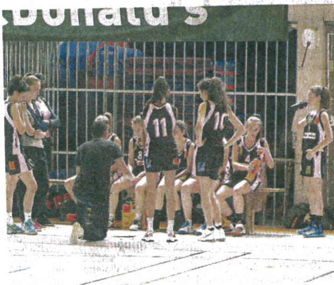
L'écoute attentive de l'entraîneur lors d'un temps mort.

Devant un public nombreux et enthousiaste, applaudissant et encourageant sans cesse, les joueuses terminent cette belle partie sur un score de 69 à 43.