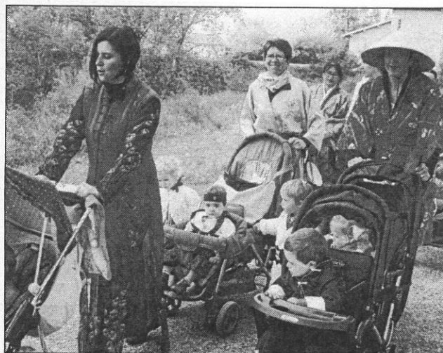
Les kimonos sont de sortie