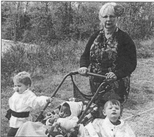
Les fleurs, symboles du printemps