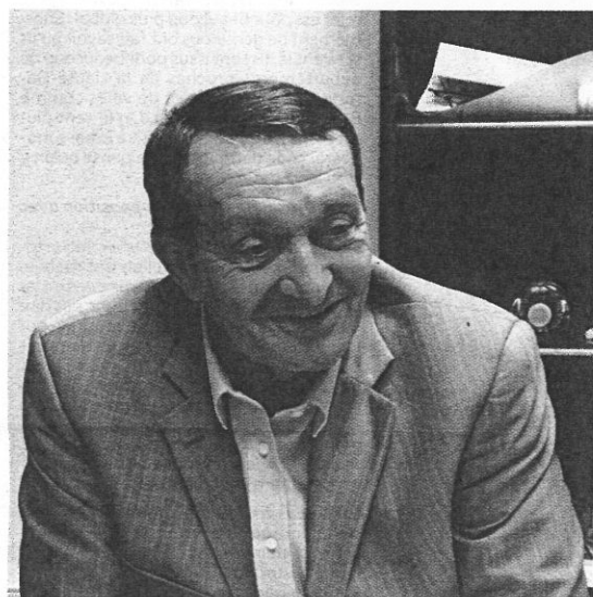
Gérard Bapt, député toulousain, particulièrement engagé dans le combat contre J. Servier